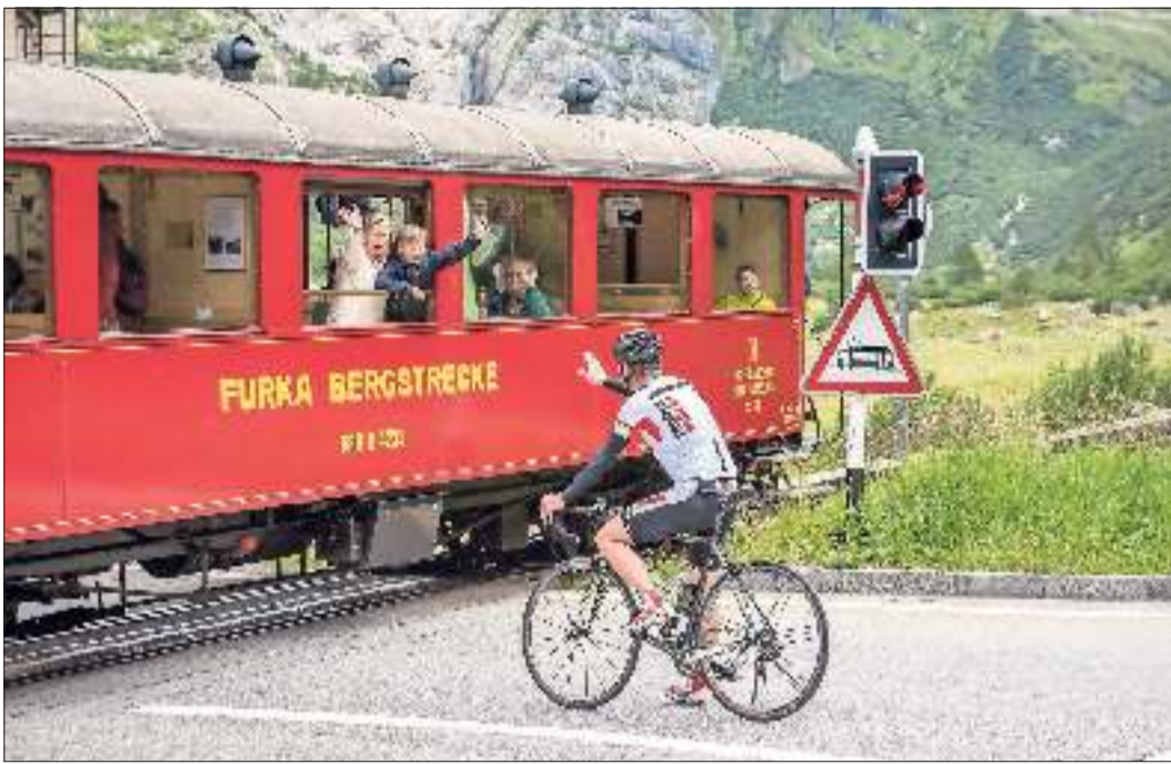
Eine Fahrt mit der nostalgischen Dampfbahn ist ein Erlebnis für die ganze Familie.