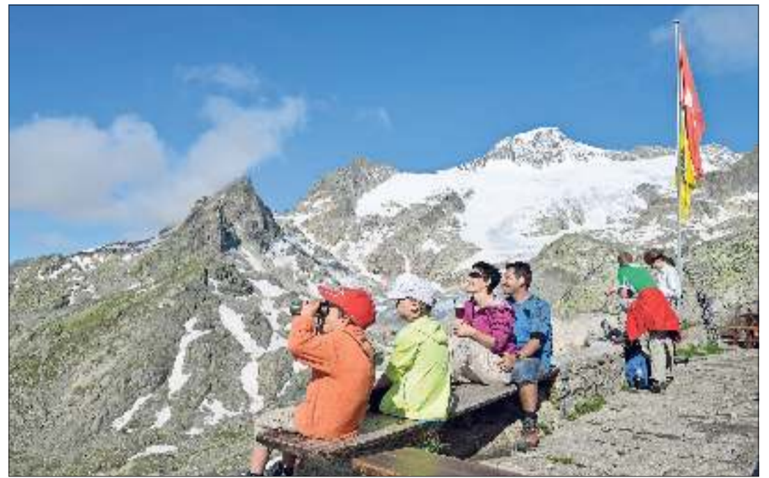
Viele Familienerlebnisse gibt es direkt vor der Haustür zu entdecken.